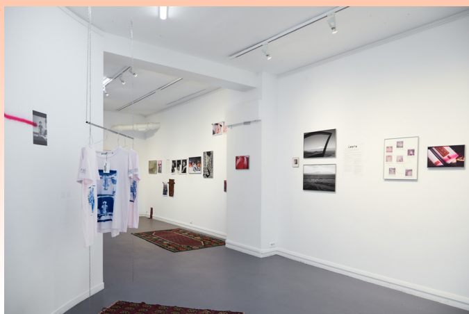
Galerie du Crous de Paris