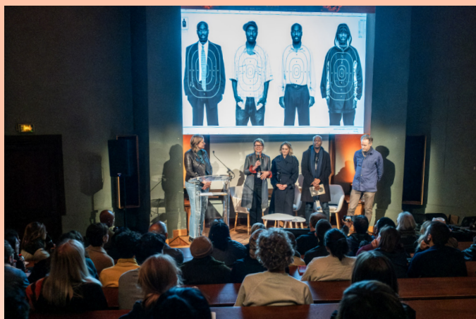
Nuit du Photojournalisme