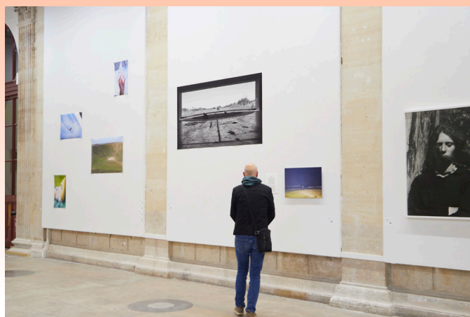
Beaux-Arts de Paris X Ensp