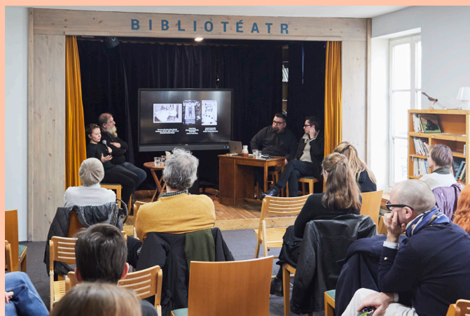
Table ronde autour de l'exposition Les Immortels