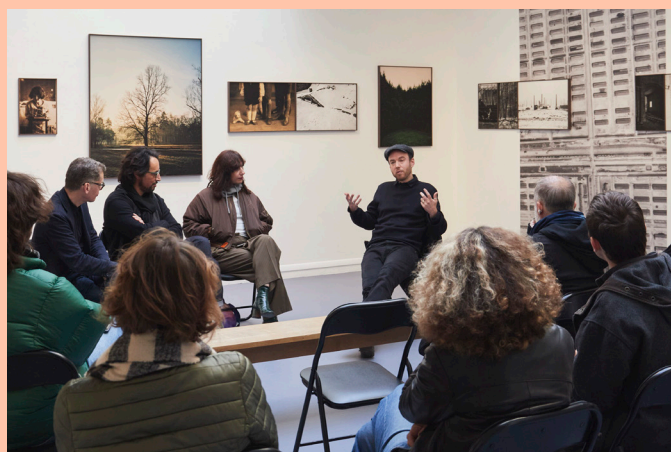
Galerie du Crous de Paris