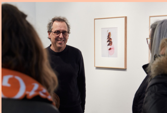
Galerie Eric Mouchet

Deux visites privées, organisées dans le cadre du parcours VIP Paris Photo, ont aussi ponctué la deuxième semaine du festival ainsi que les visites des équipes de l'ADAGP, Fetart, et des membres des Filles de la Photo.