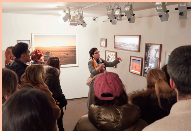
Rubis Mécénat hors les murs