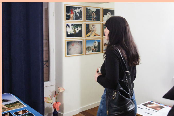
Hôtel la Louisiane - Room Service

Un calendrier d'une vingtaine de rencontres réunissant artistes et commissaires était proposé au public. Parmi ce programme d'événements, la nuit du photojournalisme en partenariat avec la Fondation Carmignac, CatchLight et Dysturb ont permis de réunir plus d'une centaine de photographes, journalistes, éditeurs photo, collectifs et créateurs de contenus numériques. L'événement a accueilli plus de 800 personnes.